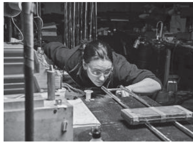
スライドも人の目で 確認しながら高い精 度で作られる

長です。人気の高い「カスタムシリーズ」のデザインをもとに開発されており、全音域において