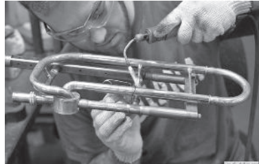
支柱のハンダ付け。こちらも手作業だ